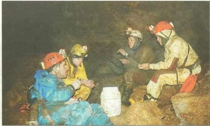
Urvotyryninkai tamsiuose požemiuose įsirengia stovyklavietes, kur nakvoja, ilsisi ir stiprinasi